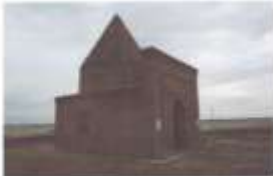
Мавзолей Кесеке – башня Замерлено

После завоевания Кавани в 1552 году распространению ислама в Поволжье и на Урале мешала изменчивая царская политика. Башкиры приняли российский подданство в 1554–1557 годах при условии, как обещал Иван IV: исповедующих ислам никогда не насильствовать и другую веру. Но власти нарушили данное обещание и добились массового крещения мусульман. Делали они это и насильственно, и предоставляли