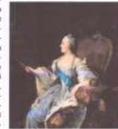
Императрица Екатерина II