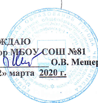
График проведения интеллектуального марафона для учащихся 5-6 классов